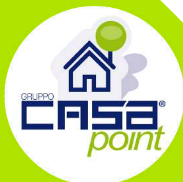
Gli Straordinari 2021 - Evento di beneficenza