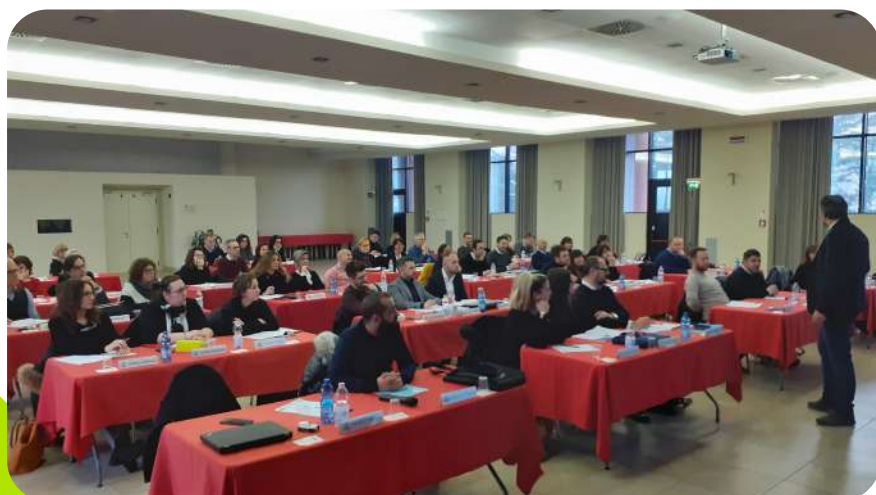
La Riunione mensile