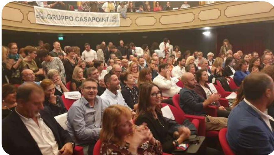
Gli Straordinari 2019 - Evento di beneficenza