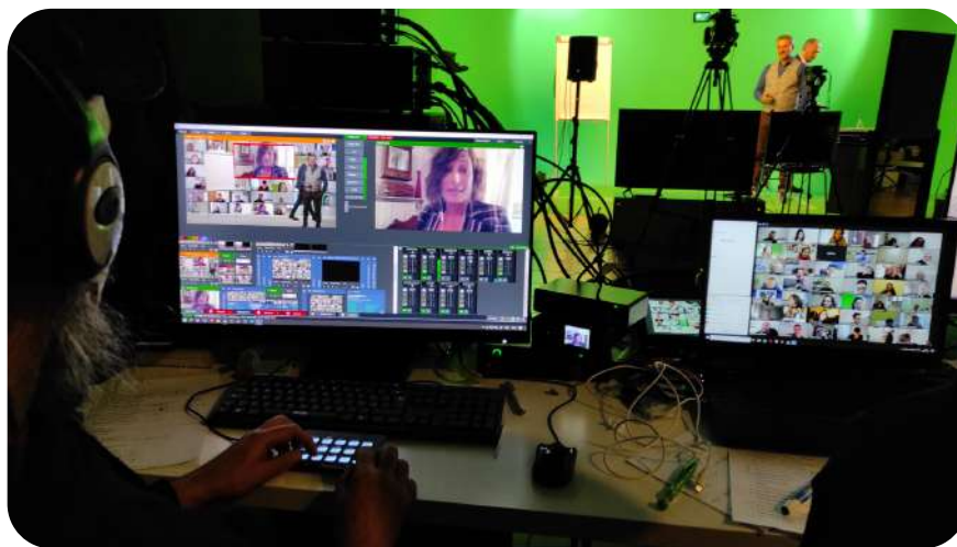
Riunione streaming 2021